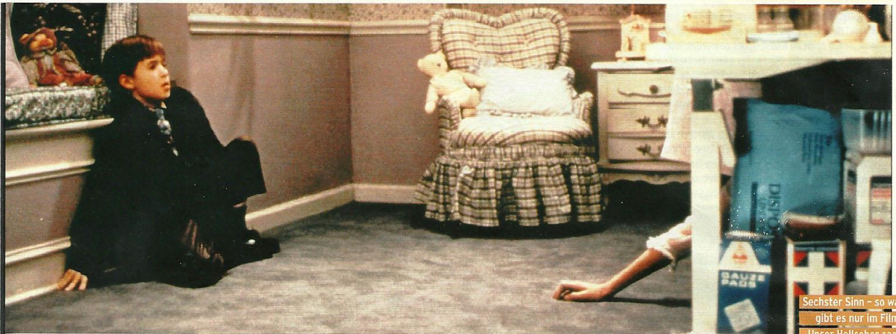
Sechster Sinn - so was gibt es nur im Film? Unser Hellseher sagt: Das gibt es wirklich!